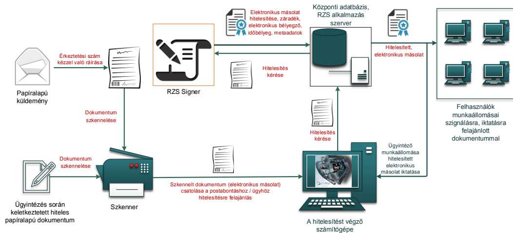
1. ábra: Papíralapú dokumentumról hiteles elektronikus másolat készítésének rendszerszintű feldolgozási folyamata