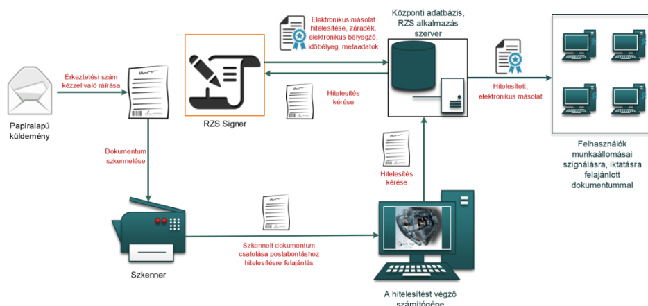
1. ábra: Papíralapú iratról hiteles elektronikus másolat készítésének rendszerszintű feldolgozási folyamata