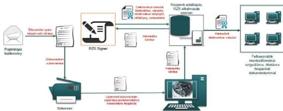
A hitelesítést végző számítógépe