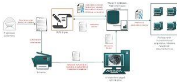
1. ábra: Papíralapú iratról hiteles elektronikus másolat készítésének rendszerszintű feldolgozási folyamata