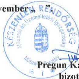
Pregun Kálmán r. alezredes bizottság elnöke