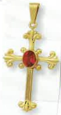
332 ~ 2,9