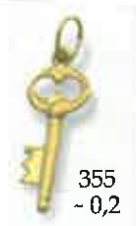
355 ~ 0,2