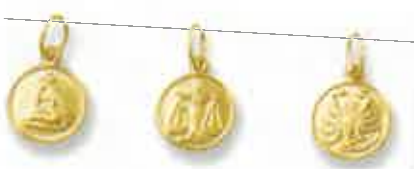
30-01 / -0,40