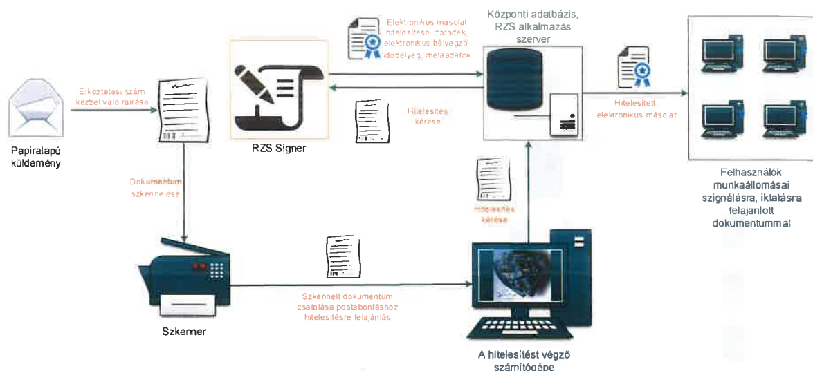
1. ábra: Papíralapú iratról hiteles elektronikus másolat készítésének rendszerszintű feldolgozási folyamata