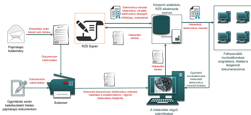
1. ábra: Papíralapú dokumentumról hiteles elektronikus másolat készítésének rendszerszintű feldolgozási folyamata

Az elektronikus aláírás, a metaadatrendszer elektronikus példányra történő bekerülésének biztonságát a szerver oldali feldolgozás biztosítja.