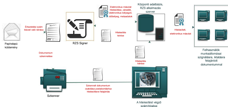
1. ábra: Papíralapú iratról hiteles elektronikus másolat készítésének rendszerszintű feldolgozási folyamata