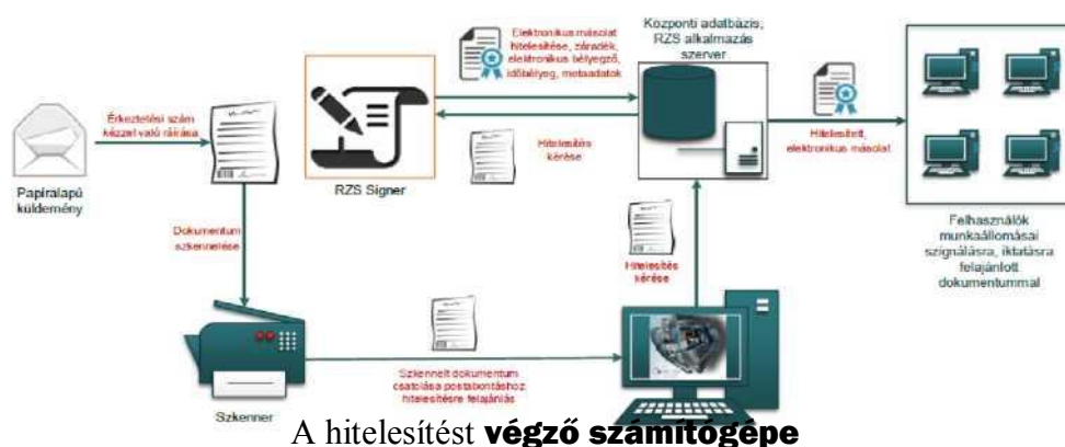
1. ábra: Papíralapú iratról hiteles elektronikus másolat készítésének rendszerszintű feldolgozási folyamata