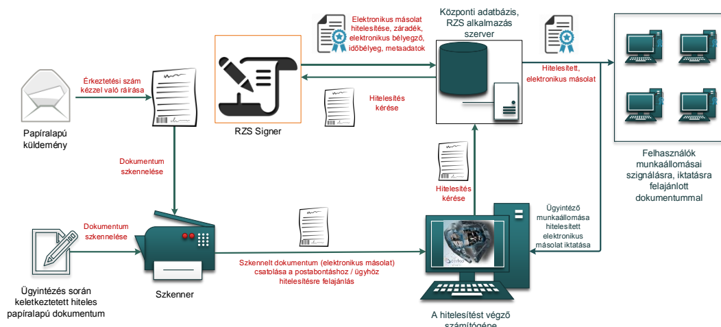
1. ábra: Papíralapú dokumentumról hiteles elektronikus másolat készítésének rendszerszintű feldolgozási folyamata