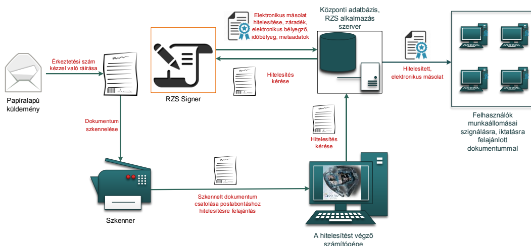
1. ábra: Papíralapú dokumentumról hiteles elektronikus másolat készítésének rendszerszintű feldolgozási folyamata