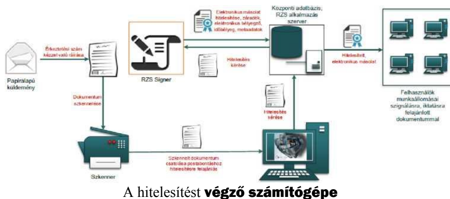
1. ábra: Papíralapú iratról hiteles elektronikus másolat készítésének rendszerszintű feldolgozási folyamata