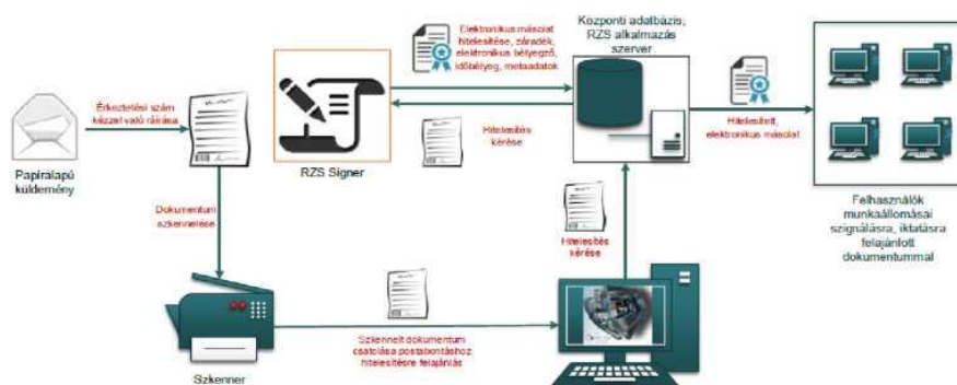
A hitelesítést végző számítógépe