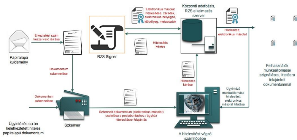
1. ábra: Papíralapú dokumentumról hiteles elektronikus másolat készítésének rendszerszintű feldolgozási folyamata