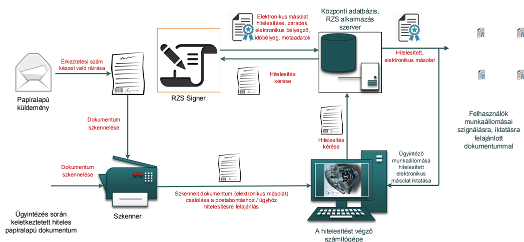
1. ábra: Papíralapú dokumentumról hiteles elektronikus másolat készítésének rendszerszintű feldolgozási folyamata